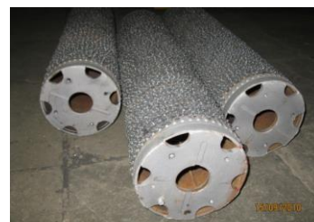
В процессе ремонта