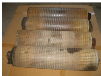
Приняты в ремонт