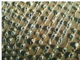
В процессе ремонта