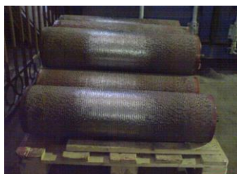
приняты в ремонт